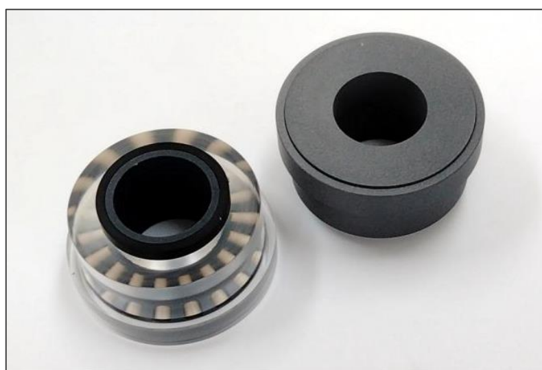
アンギュラタイプ樹脂ベアリング 縦軸仕様