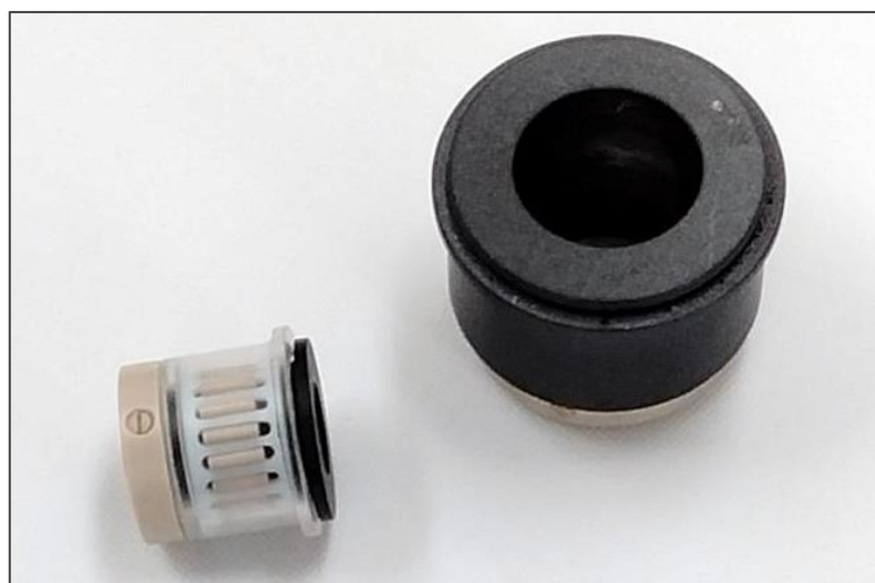
ニードルタイプ樹脂ベアリング 横軸仕様